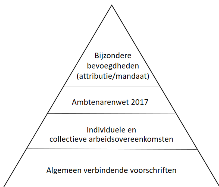
Figuur 2 – Vierlagenmodel